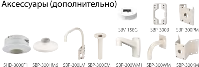
SHD-3000F1 SBP-300HM6 SBP-300LM SBP-300CM SBP-300WM1 SBP-300WM SBP-300KM